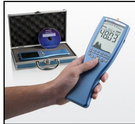
נתוני מכשיר ארונייה:

מכשיר מדויק בעל רגישות גבוהה, טווח מדידה רחב ויכולת לאגור נתונים.